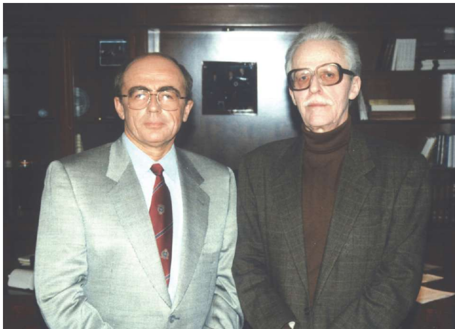
Фотография на память в кабинете ректора СПбГУП

скорее вы сможете этому научиться, тем больше вы успеете сделать хорошего в жизни. Надеюсь, что так оно и будет.