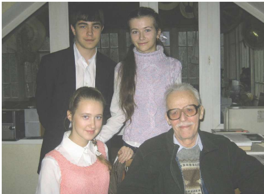
Школьники в гостях у писателя

Творчество нашего земляка, писателя Бориса Львовича Васильева, относится к прошлому - XX веку. В мире и в нашей стране произошли большие исторические изменения, вступило в жизнь не одно новое поколение. Краеведам нашей гимназии и мне хотелось узнать, где и как прошло детство писателя, какова его гражданская позиция, хотелось найти по его книгам связующую нить между поколениями.