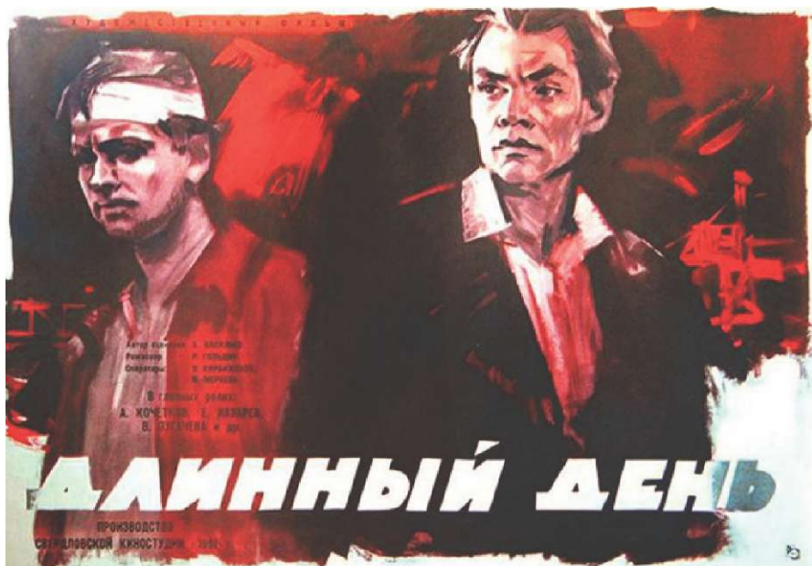
Афиша фильма «Длинный день»