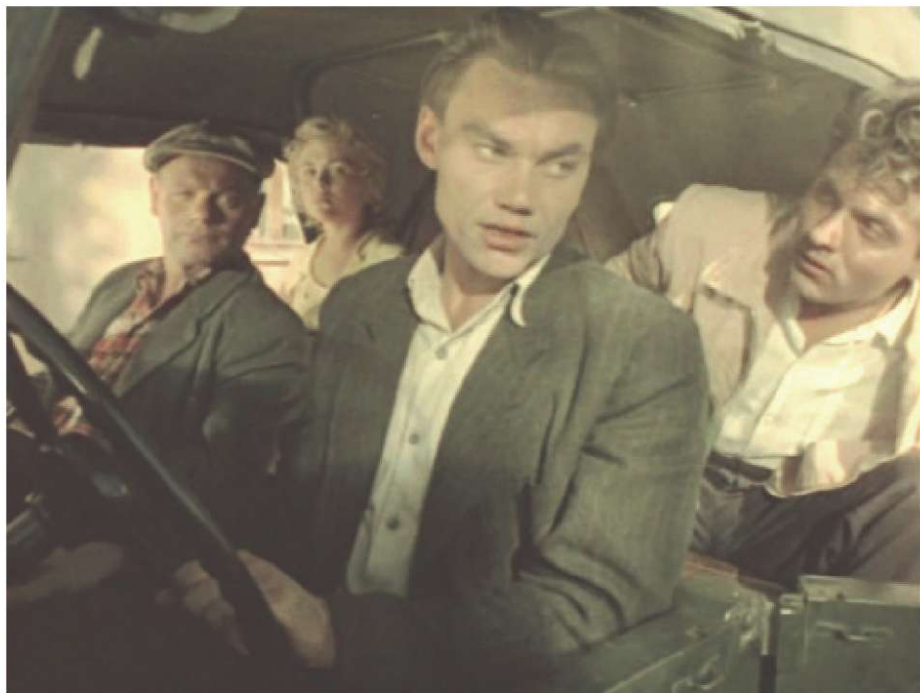
Кадр из фильма «Длинный день» по сценарию Бориса Васильева